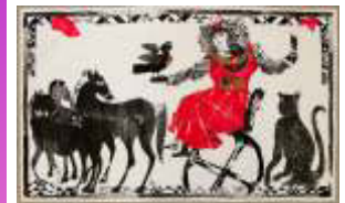
Käte Müller, Collage

PIKANTA AKADEMIE: Dienstag ab 18 Uhr: Mal-/ Grafikwerkstatt Mittwoch ab 15 Uhr: Ton & Kreation für Kinder und Jugendliche Mittwoch ab 18 Uhr: Tonwerkstatt / Erwachsene Donnerstag ab 10 Uhr und ab 16 Uhr: Kreation & Ton nach Voranmeldung für Projekte, Kreativ-Parties, Schnupperkurse, etc. für Kinder, Jugendliche & Erwachsene