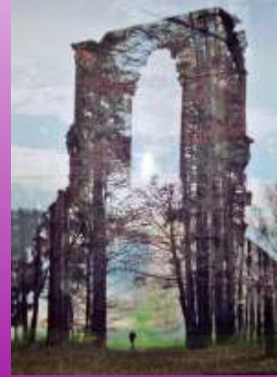
Sven Abraham, o.T. Photographie Karla Vogt, „Rom“, Fotografie Sigrid Schmidt, Montage, Fotografie