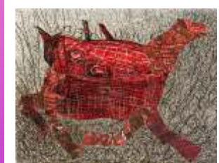
Christa Jähr, Collage

PIKANTA AKADEMIE: Dienstag ab 18 Uhr: Mal-/ Grafikwerkstatt Mittwoch ab 15 Uhr: Ton & Kreation für Kinder und Jugendliche Mittwoch ab 18 Uhr: Tonwerkstatt / Erwachsene Donnerstag ab 10 Uhr und ab 16 Uhr: Kreation & Ton nach Voranmeldung für Projekte, Kreativ-Parties, Schnupperkurse, etc. für Kinder, Jugendliche & Erwachsene