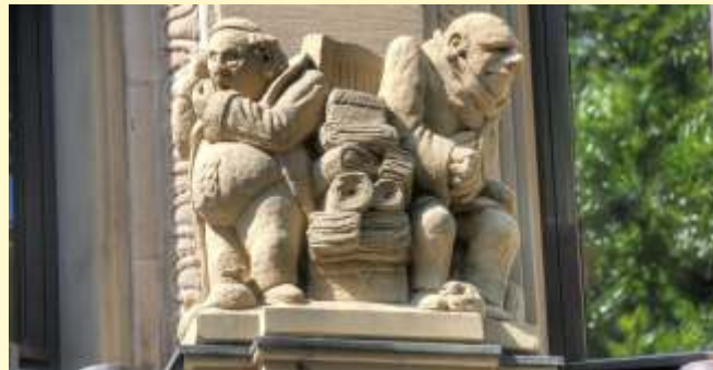
Zwei Reliefs zu „Des Kaisers neue Kleider“ in Köln an der Brückenstraße