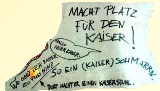
Spontan Notiertes von Philipp Karp, Skizze auf Packpapier, links und oben

👁️ ACHTUNG: im PIK ART JAHR finden ergänzend zum Projekt WorkShops, Gespräche, Vorträge, Exkursionen, Lesung etc. statt – 🗨️ 👉 Einladungen erfolgen dazu zeitnah! Eventuelle auch externe Ausstellungen, die ich aktuell ergeben.