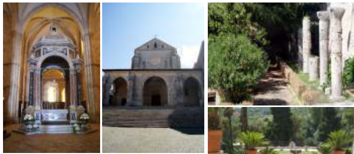
links, Mitte, rechts: Abbazia di Casamari darunter: Orte

Es hat uns sofort „adoptiert“ und auch ohne Prozession fasziniert als eine authentisch italienische Stadt, wenn man denn den Hügel erklommen hat (dahin fahren kleine Busse). Jetzt kommt es auf eine strategisch intensive Feinstplanung an, all die Schönheiten unter einen „BUSFAHRTAG“ zu bekommen. Einmal im Norden des Lazio, also vom Quartier in / bei Bomarzo aus und dann im Süden Roms hinein in das südliche Lazio. Dabei entstehen unglaubliche Kontraste zwischen Roma Eterna und der Umgebung, manchmal ein „vergessenes“ Land. Wir haben Abbazia-Schönheiten entdeckt, die eine ideale Ergänzung zu schon Gesehenem bieten: z.B. die von Casamari. Ideal, um den Eindruck von Farfa zu vergleichen... Oder die gigantischen Zyklopenmauern der Herniker in Alatri. So entsteht die großartige Chance, Schönheiten zu entdecken, die kein „Allgemeingut“ sind. Für die Rückreise-Station suchten wir Trento / Trient auf. Diese Grenzstadt hat uns total begeistert. Eine pulsierende Stadtschönheit, reich an Palazzi, Schloss und Festungen, wozu natürlich Zinnen gehören, vervollständigt mit römischen Ruinen, mittelalterlichen