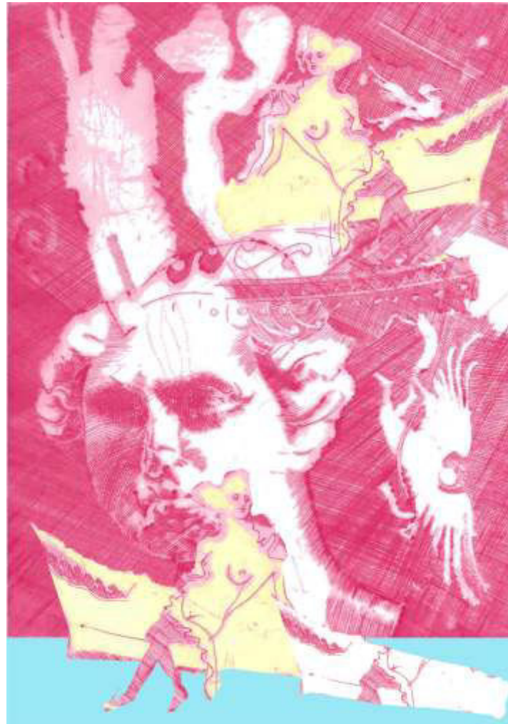
Wolfgang Böttcher, „Cesares Lustfahrt“, Kupferstich & Collage