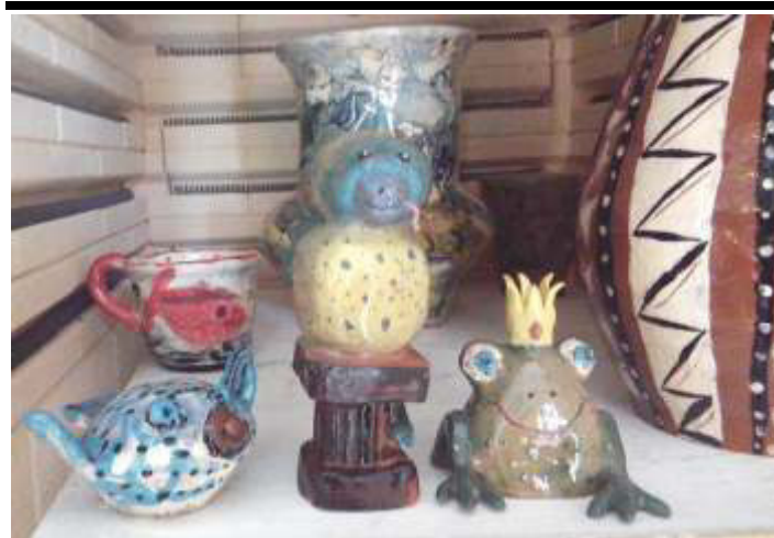
PIKANTA AKADEMIE Kaiser-Kinder wollen raus aus dem Ofen

Die PIKANTA AKADEMIE bietet Kurse, Workshops und creative Aktionen an. ALLE Veranstaltungen finden in der jeweiligen AUSSTELLUNG statt und ergänzen diese!