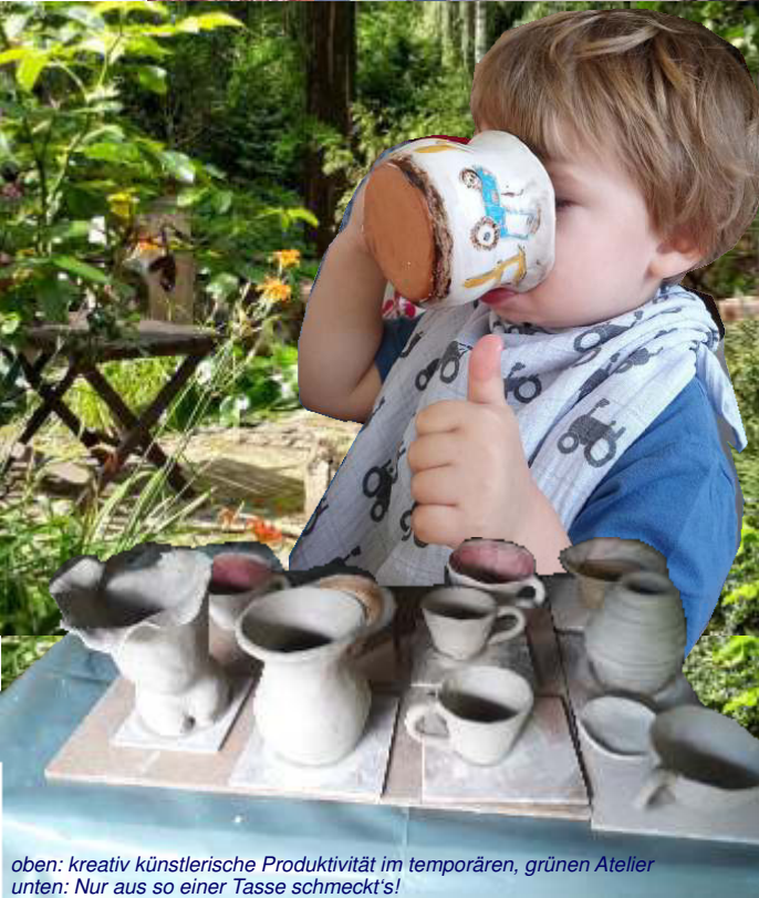
oben: kreativ künstlerische Produktivität im temporären, grünen Atelier unten: Nur aus so einer Tasse schmeckt's!

ANMELDUNG BINDEND erforderlich - AB SOFORT - Teilnahme bei Überschreiten der Personenanzahl nicht möglich