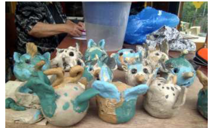
TWITTERNDE Vögel, mal nicht im Netz, sondern TÖNERN, tönernes Fabelgier und solide Vasen für alle möglichen Blumen, Zweige, Äste etc

plus Beitrag: Brenngebühr, 2xOfen, Glasieren inklusive Glasur & transport - gemeinsam (%) mit MATERIALKOSTEN zahlbar!