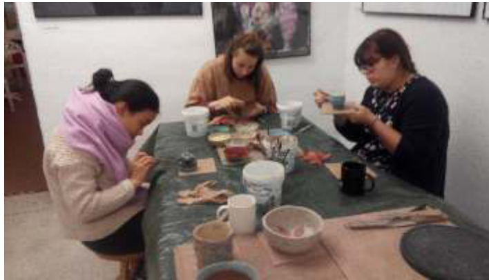
PIKANTA AKADEMIE in der GALERIE : der schöne Moment des Bemalens

Dienstag (ab 17.00 - 19.30 Uhr) und Mittwoch (15.00 - 17 Uhr) zu Kurszeiten die Galerie besuchen!!!