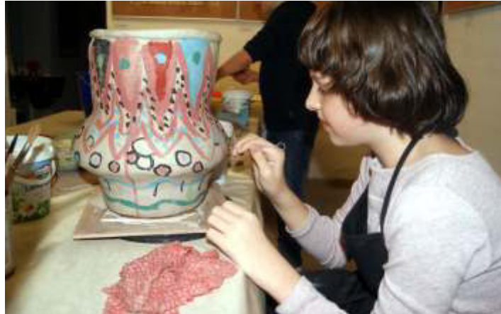
PIKANTA AKADEMIE in der GALERIE : der schöne Moment des Bemalens

Mittwoch (15.00 - 17 Uhr) zu Kurszeiten die Galerie besuchen!!!